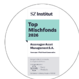
SZ Institut Top Mischfonds 2026 Anteilsklasse P