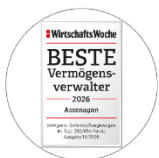
WirtschaftsWoche BESTE Vermögensverwalter 2026