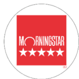
Morningstar Rating™ Overall as of 31 May 2026